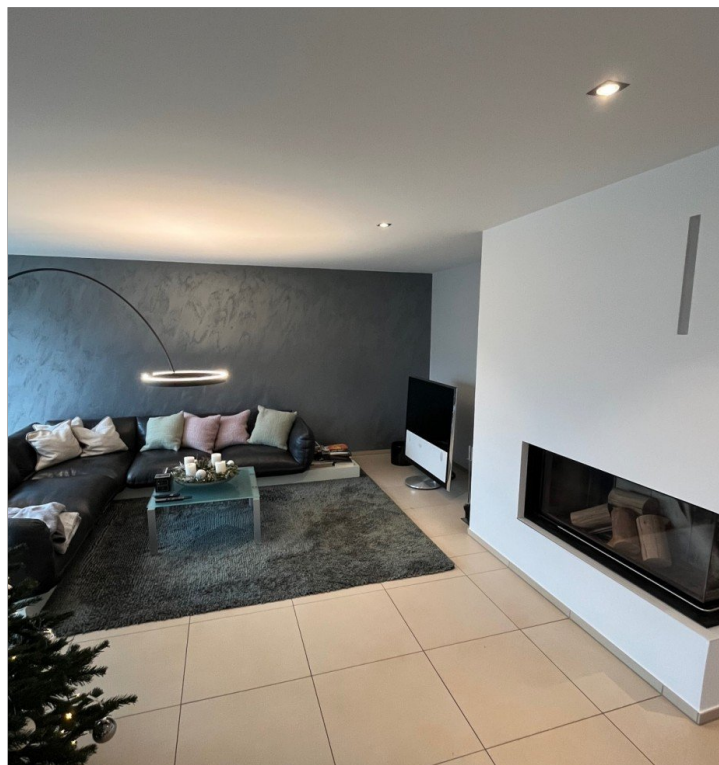
Wohnbereich inkl. Kamin