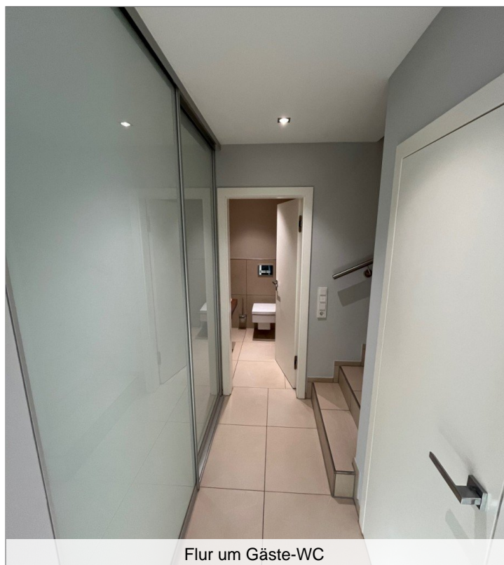
Flur um Gäste-WC