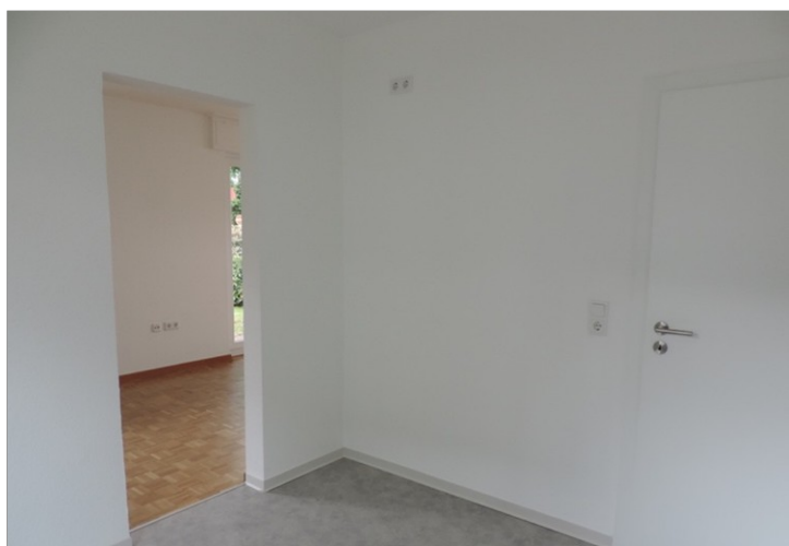
Küche zum Flur