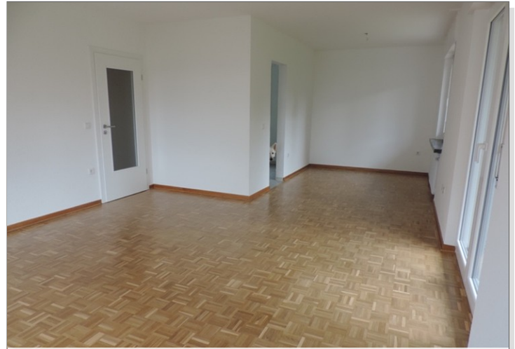
Wohnzimmer mit Essbereich