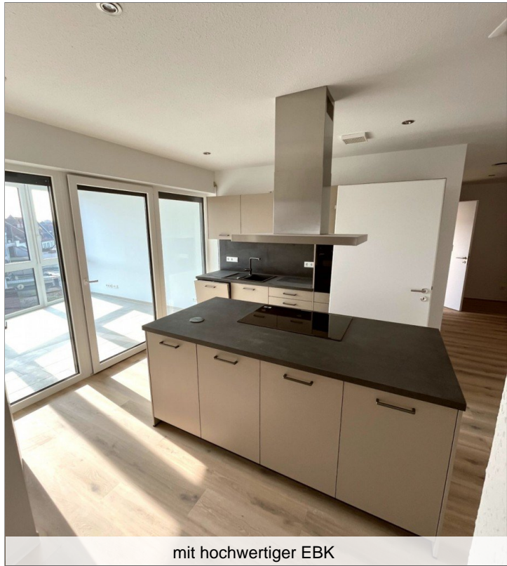
mit hochwertiger EBK