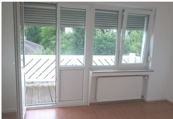
Zimmer zum Balkon