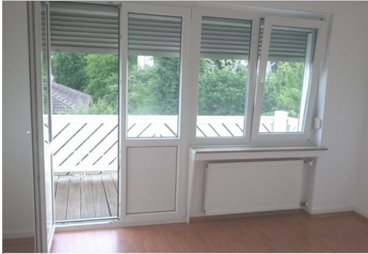
Zimmer zum Balkon